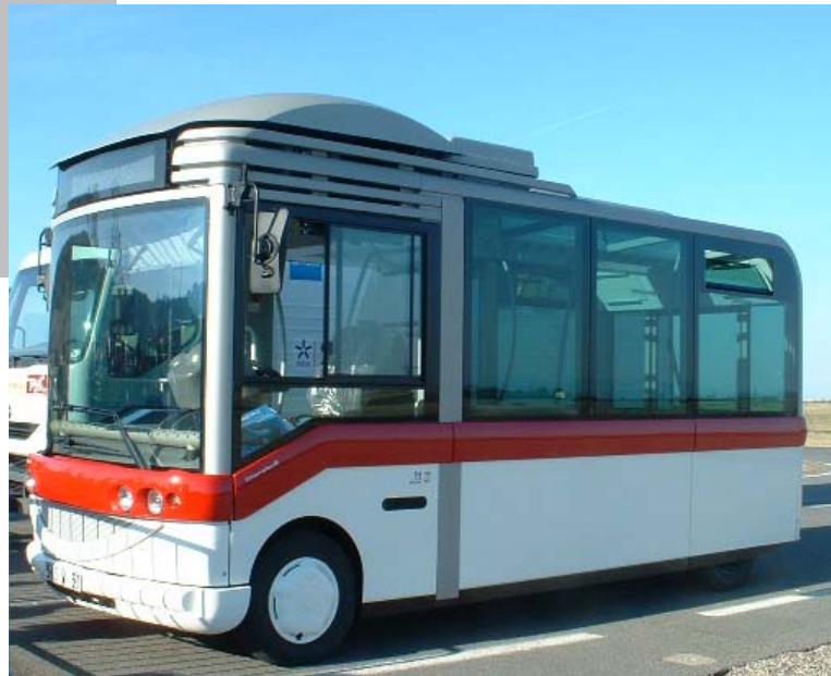
Le microbus Citadine

Contact presse : SMTC – 04.73.44.68.44 T2C – 04.73.28.56.77